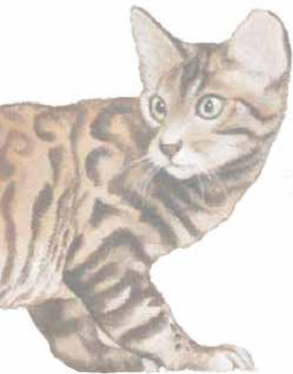
Le chat peint (pas le sapin...) au dessus de la fenêtre

C'est encore plus simple, la première à gauche après le panneau Molsheim (avant la petite zone commerciale) suivre le panneau « Maternelle des Prés ».